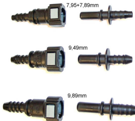
Набор пластиковых адаптеров