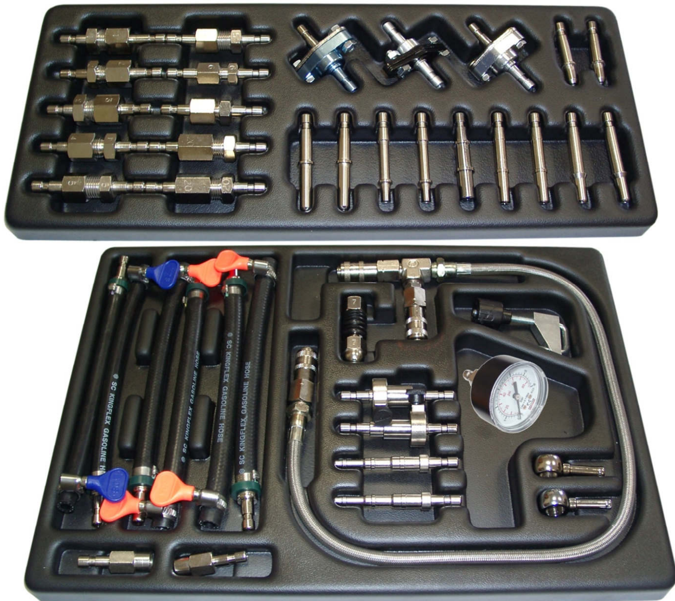
Рисунок 1. Расположение фитингов в ложементах