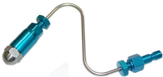
Форсунка для распыления моющей жидкости